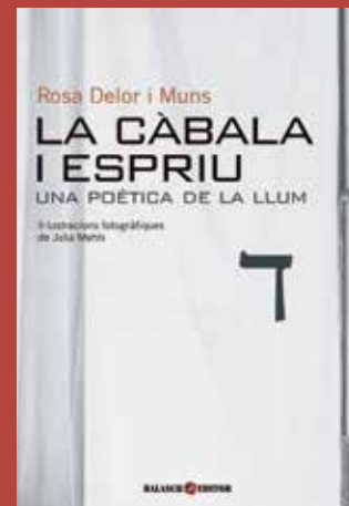
La Càbala i Espriu. Una poètica de la llum, de Rosa Delor i Muns, amb fotografies de Julia Mehls.