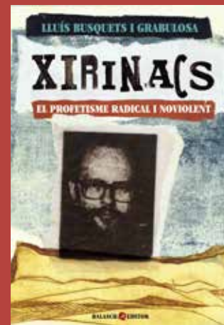
Xirinaçs. El profetisme radical i noviolent, de Lluís Busquets i Grabulosa, amb il·lustracions de Gemma Molera i Jordi Junyent.